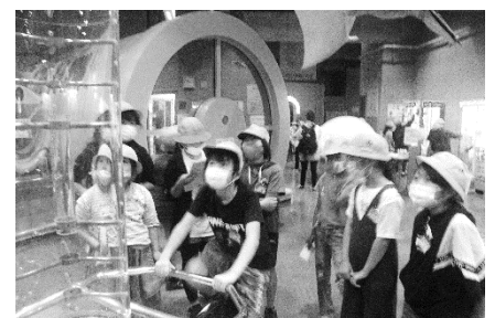
伊勢原子ども科学館

10月20日(水) 子ども科学館 伊勢原子ども科学館では、プラネ タリウムと科学の体験をしまし た。もう一度行ってみたいとなっ た子が多かったです。