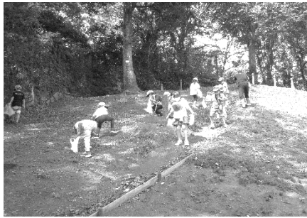
1 年生 吾妻山

10月8日(金) 秋の自然探し 学校から吾妻山に行く道で ングリや葉っぱを拾いました。 学校で、拾ってきたものを貼り 絵にしました。