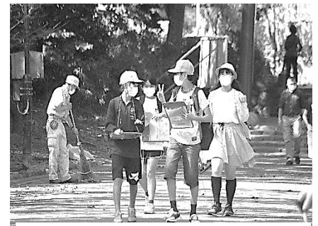
6 年生 鎌倉班別行動

10月11日(月) 鶴岡八幡宮 自分たちで見学する神社仏閣の 行程を計画しました。班の仲間 と話し合いながら楽しく見学す ることができました。