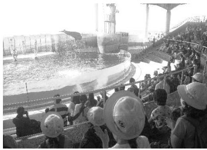
2 年生 新江ノ島水族館

10月5日(火) イルカショー 子どもたちに聞くと、一番思い 出に残ったのがこのイルカシ ョーで、学校に帰って多くの子 が絵に描いていました。