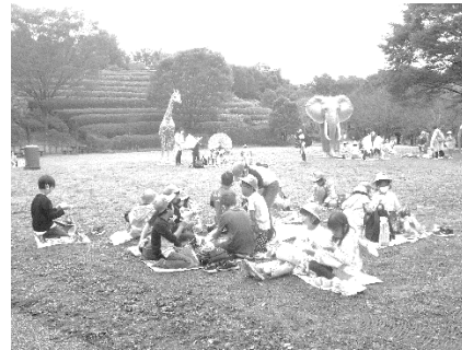
3 年生 よこはま動物園ズーラシア

10月13日(水) お弁当 あいにくの雨模様でしたが、そ の分気候も涼しく、ホッキョク グマなどが、活発に動いていま した。