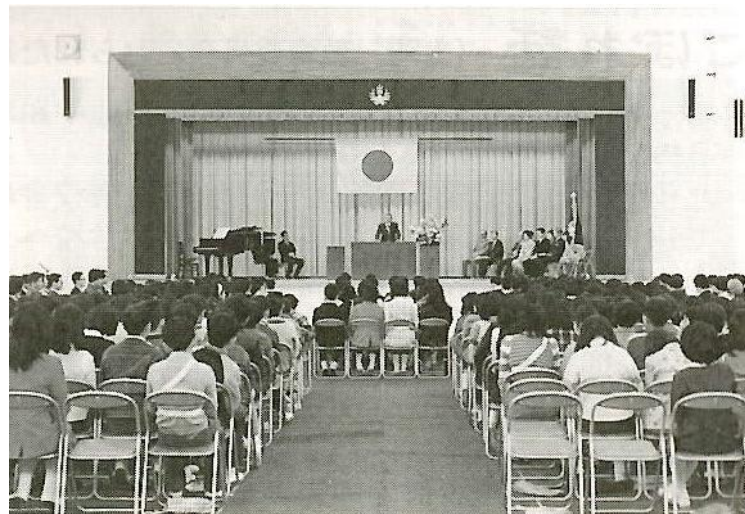
S53 (1979年) 3月24日 第1回卒業式