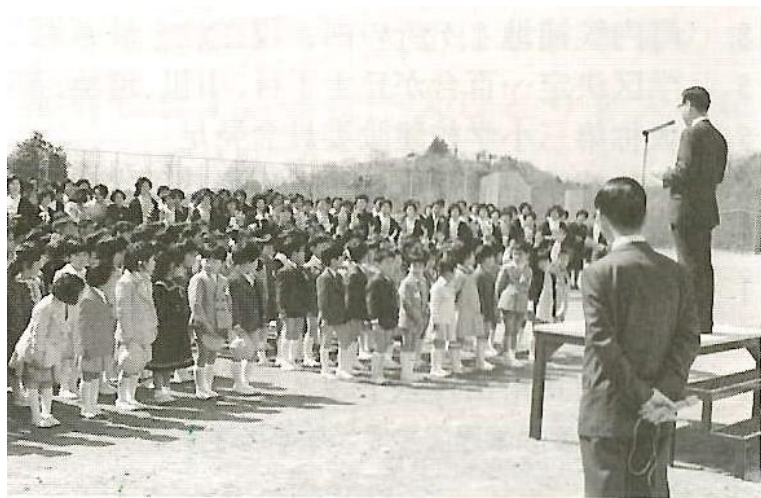
S52 (1978年) 4月5日 第1回入学式