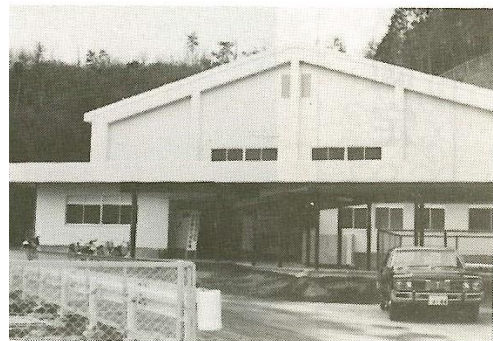
S53 (1978年) 2月6日 体育館落成式