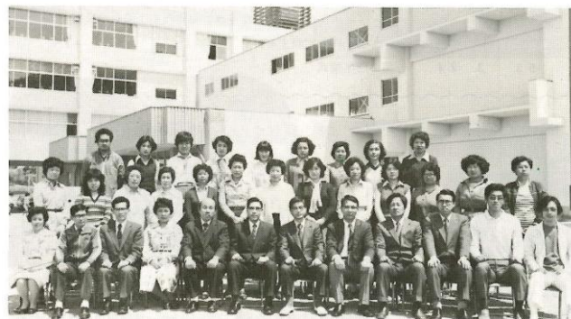
開校当時の職員写真